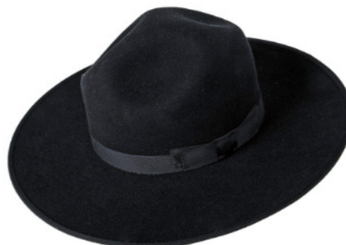
F158 Zimmermannshut, 100% Wolle Randbreite 12 cm Farbe schwarz Gr. 54 - 62 75,00 €