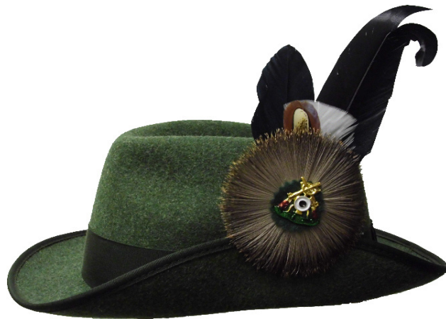
O272112 - dunkelgrün-meliert, mit Druckknopf Gr. 54 - 62 52,95 €