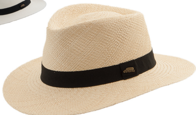
F39209 100% Panama-Stroh mit UV-Schutz Fb. Natur, weiß, Gr. S/55 - XL/61 109,00 €