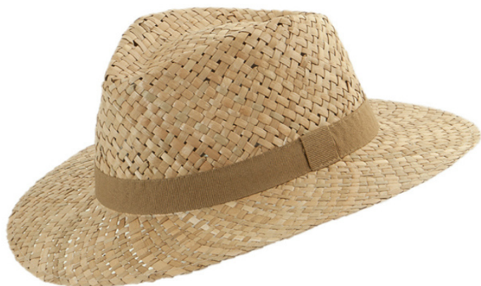
F43346 Hut, 100% Stroh, Fb. natur Gr. S/55 - XXL/63 16,95 €