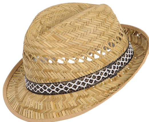
F2004 Hut, 100% Stroh, Fb. natur Gr. 53 - 63 13,95 €