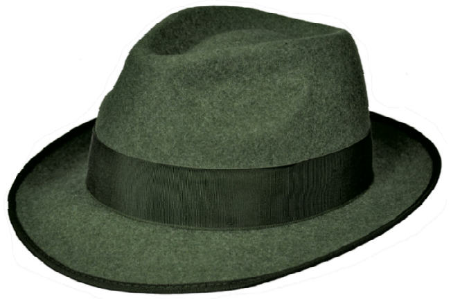
0272102 - dunkelgrün-meliert