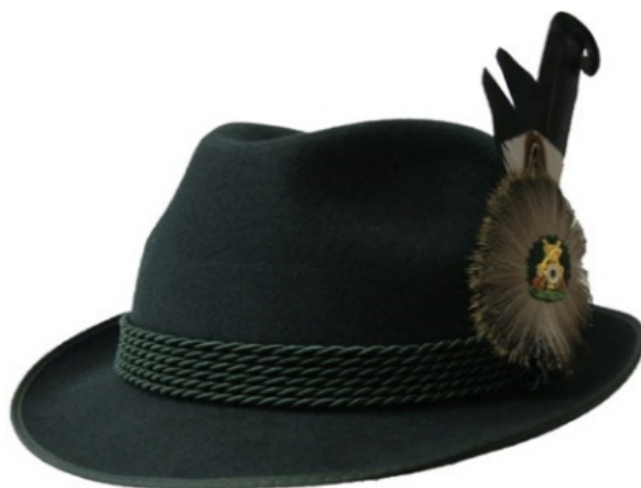
F1442406 - 100% Wolle grün, 6 Kordeln grün 49,95 €