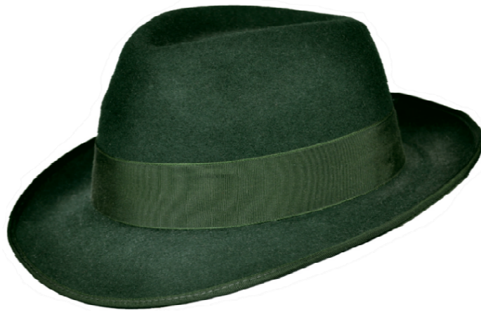
0272100 - Fb. 315 olivgrün 49,95 €

Klassischer Schützenhut, 100% Wolle, mit Hutband und Einfassband grün in Ripsoptik Innen mit Hutband aus Leder-Imitat für optimalen Tragekomfort