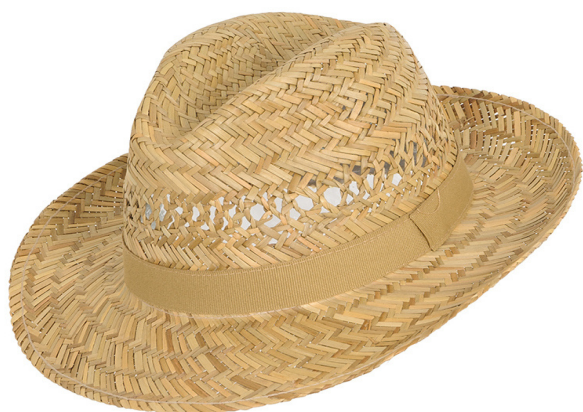
F2012 Hut, 100% Stroh, Fb. natur Gr. S/55 - XXL/63) 14,95 €