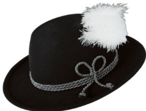
F207 Trachtenhut, 100% Wolle Fb. Schwarz, ohne Feder Garnitur nach Wunsch Gr. 54 - 61 99,50 €