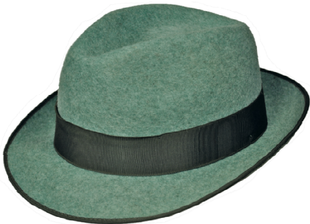
0272101 - grün-meliert