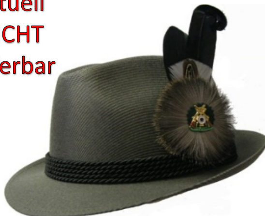
M1201026 Schützenhut, Dralon Sportform, mit Kordelgarnitur Farbe schilfgrün Gr. 54 - 61 66,50 €