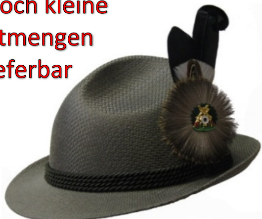
M1201589 Schützenhut, Dralon Trenkerform, mit Kordelgarnitur Farbe schilfgrün Gr. 54 - 61 66,50 €