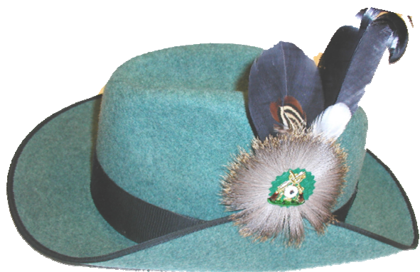
801-D4587 Deutscher Schützenhut, 100% Wolle reseda-meliert, Einfaß- u. Ripsband dunkelgrün Gr. 54 - 62 109,00 €