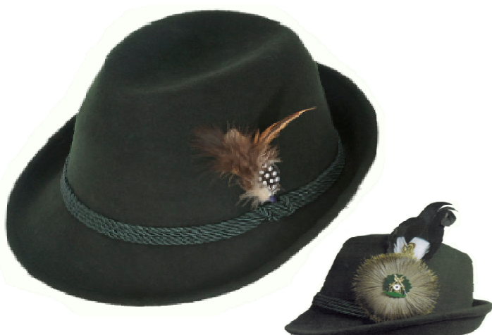
F801243 - 100% Wolle, forstgrün, 4 Kordeln Gr. 54 - 61 29,95 €