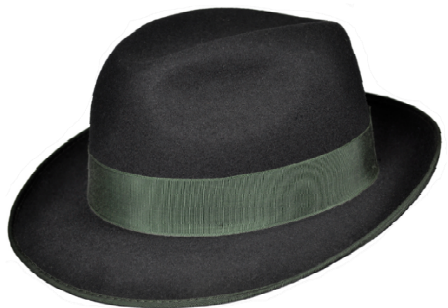
0272106 - schwarz