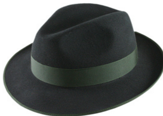
F36501 E Bogart-Hut, 100% Wolle, schwarz 298-1013 Hut- und Einfassband grün Gr. 55 - 61 49,50 €