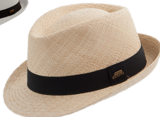
F40230 100% Panama-Stroh mit UV-Schutz Fb. natur, weiß Gr. S/55 - XL/61 109,00 €