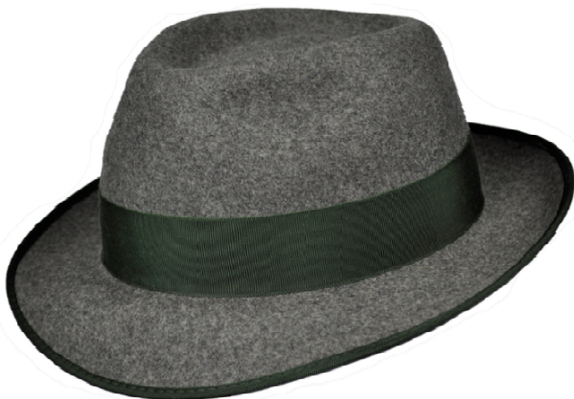
0272103 - mittelgrau-meliert