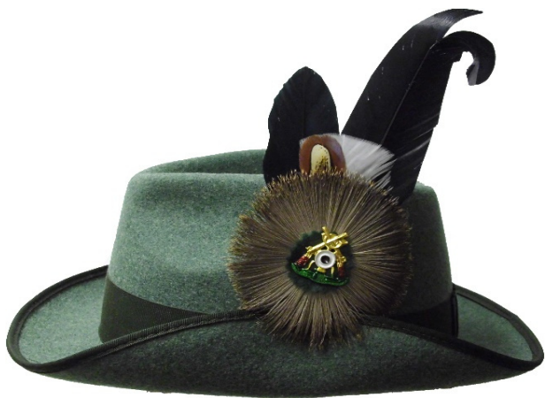
O272111 - grün-meliert, mit Druckknopf Gr. 54 - 62 52,95 €

Die Preise verstehen sich OHNE Feder - Preisänderungen vorbehalten.