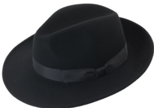
F36501 Bogart-Hut, 100% Wolle, schwarz Hut- und Einfassband schwarz Gr. 55 - 61 46,50 €