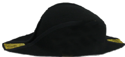
S23096 nur Fransen