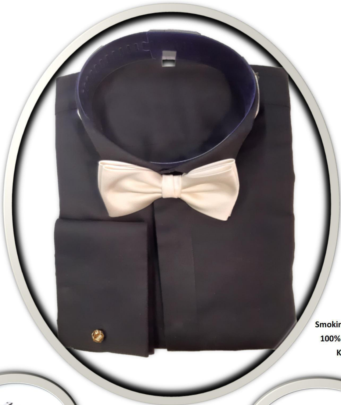
Smokinghemd schwarz 100% Baumwoll-Twill Klappchenkragen 49,50 €

Die passende Schleife und elegante Manschettenknöpfe für das formvollendete Outfit.