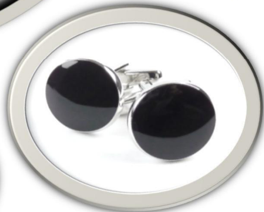
Manschettenknöpfe, ab 18,95 €