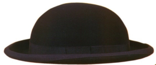
S16040 Dachauer 115,00 €