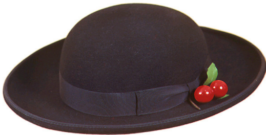
S16051 Renchtaler Trachtenhut 115,00 €