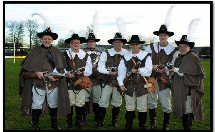
Hunteburger Karbid Böller Verein

Sonderanfertigungen Modell und Farbe nach Wunsch