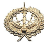
02180 4,40 €