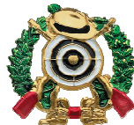
A59.1 3,65 €