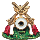
A59.2 3,60 €