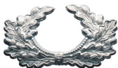
15452 5,90 €