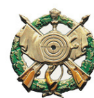
00902 3,60 €