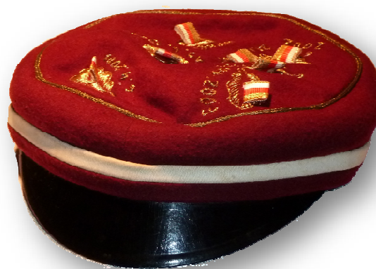
Studentenmützen, Kyffhäusermützen Tschakos, Kolbacken, Südstaatler

https://www.kiveling.de/die_kiveling/das_koenigspaar/vergangene_koenige_und_koenigspaare_der_kiveling.html