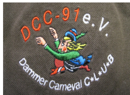
Stickerei auf T-Shirts