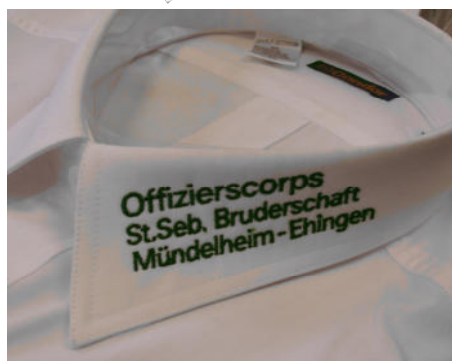
Hemden- und Blusen Kragenbestickung