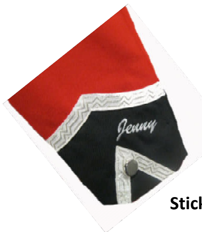
Stickerei auf Jackenärmel

Durch die individuelle Bestickung erhalten Sie einzigartige Bekleidung !