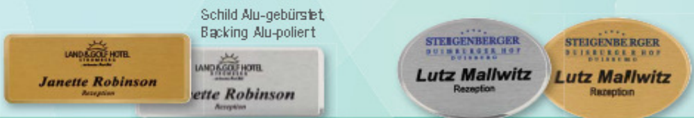
Schild Alu-gebürstet Backing Alu-poliert