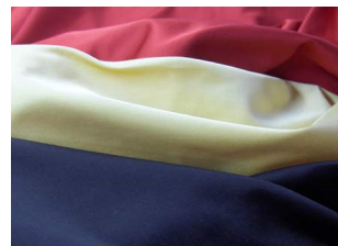
Seide/Baumwolle - Diagonal