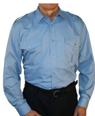
Diensthemd 1/1 Arm mit eingenähter Schulterklappen B 9170 41,50 €