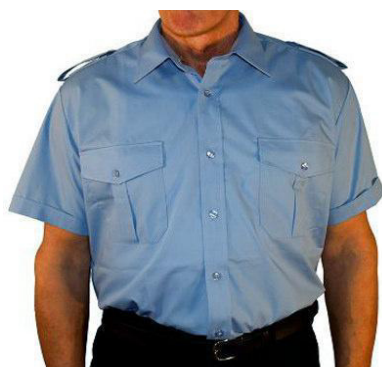
Diensthemd 1/2 Arm mit Tunnel und Schulterklappe B 9120 39,50 €