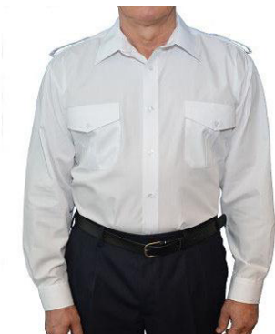
Diensthemd 1/1 Arm mit Tunnel und Schulterklappen B 9130 41,50 €