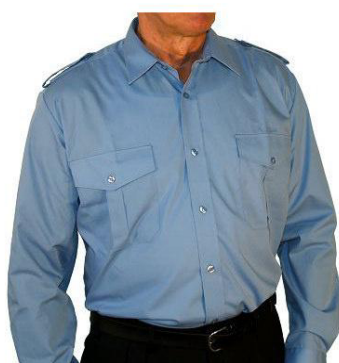
Diensthemd 1/1 Arm mit Tunnel und Schulterklappen B 9160 41,50 €