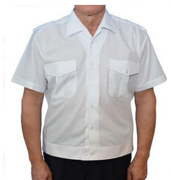
Blouson 1/2 Arm weiß mit Tunnel und Schulterklappen B 9145 46,50 €