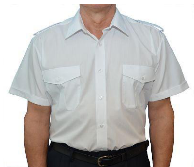
Diensthemd 1/2 Arm weiß mit Tunnel und Schulterklappen B 9133 39,50 €

Mischgewebe 55%/45% Polyester/Baumwolle, Gr. 36 - 52