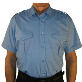
Diensthemd 1/2 Arm mit eingenähter Schulterklappen B 9180 39,50 €