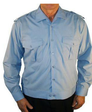
Blouson 1/1 Arm bleu mit Tunnel und Schulterklappen B 9190 46,50 €