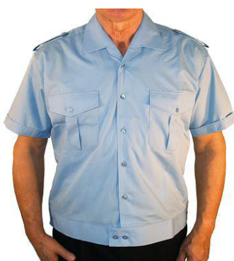
Blouson 1/2 Arm mit Tunnel und Schulterklappen B 9195 44,50 €