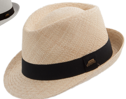
F40230 100% Panama-Stroh mit UV-Schutz Fb. natur, weiß Gr. 55, 57, 59, 61 109,00 €