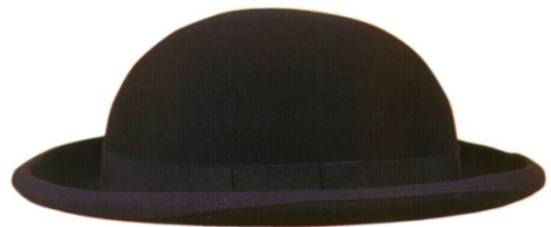
S16040 Dachauer auf Anfrage