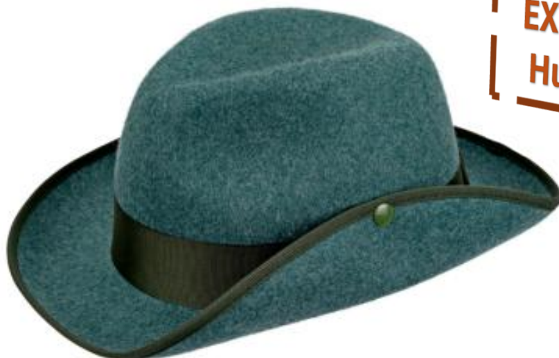
O272133 - petrol mit Druckknopf Gr. 53 - 63 64,95 €

Schützenhut 100% Wolle, mit extrabreiter Krempe und Einfassband Seitlicher Druckknopf zum Hochklappen der Krempe, Ripsband