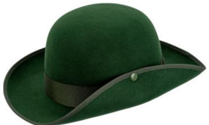
0272165 - tanne