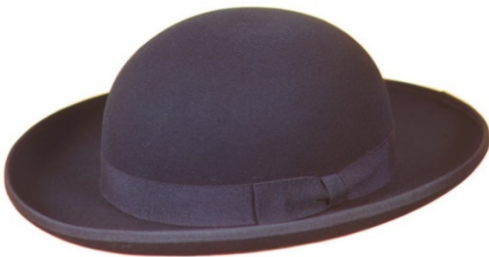
S16050 Schwarzwälder auf Anfrage

Sonderanfertigungen Modell und Farbe nach Wunsch