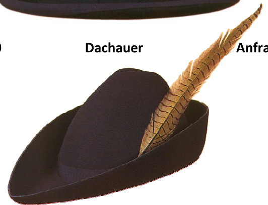
S16070 Rattenfänger auf Anfrage