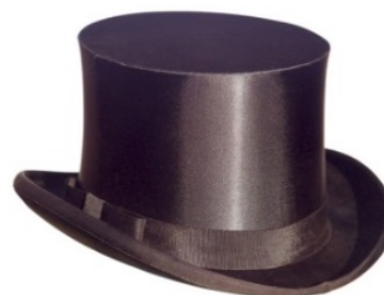
E80021 Zylinder Chapeau-Claque original oder nicht klappbare Ausführung auf Anfrage