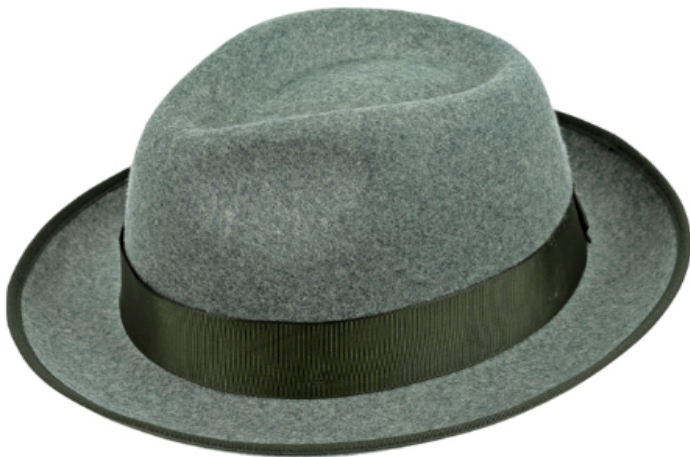
0272101 - grün-meliert