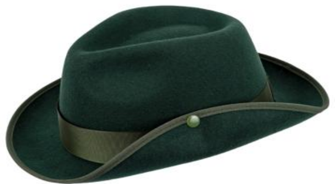
0272110 - oliv uni, mit Druckknopf Gr. 54 - 63 59,95 €