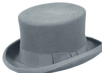
S16030 Zylinder, 100% Wollfilz Band und Einfass schwarz schwarz, rot, blau, grün 139,00 €