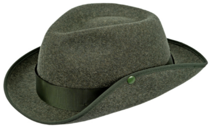
0272112 - dunkelgrün-meliert, mit Druckknopf Gr. 54 - 63 59,95 €