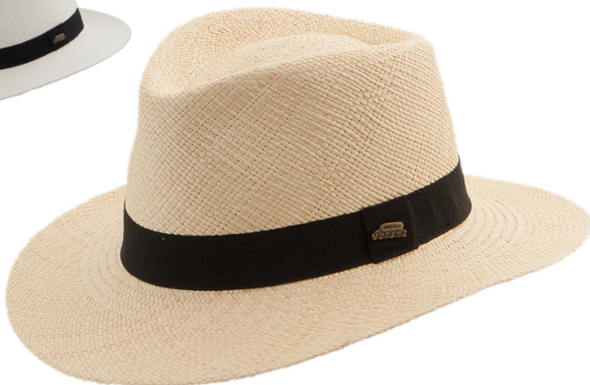
F39209 100% Panama-Stroh mit UV-Schutz Fb. Natur, weiß, Gr. 55, 57, 59, 61 109,00 €