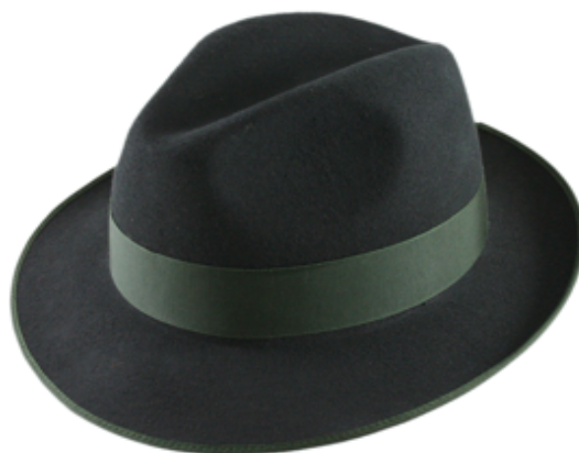
F36501 E Bogart-Hut, 100% Wolle, schwarz Hut- und Einfassband grün Gr. 54 - 61 49,50 €