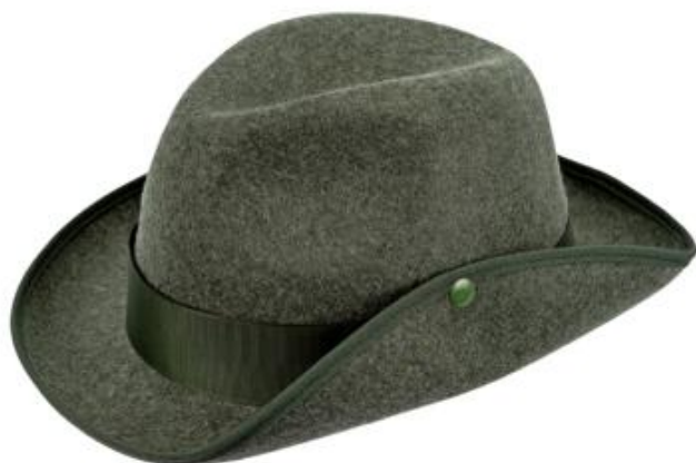
O272132 - dunkelgrün-meliert, mit Druckknopf Gr. 54 - 63 64,95 €