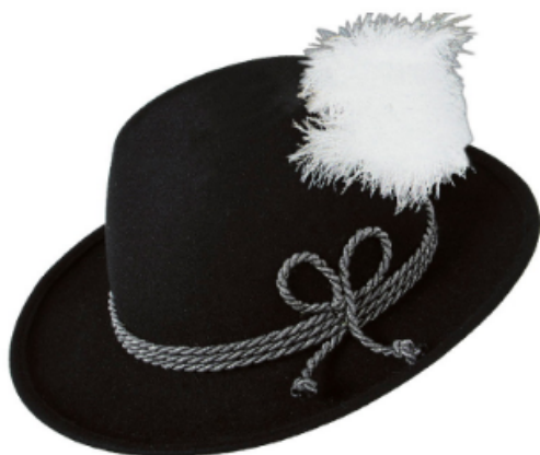
F207 Trachtenhut, 100% Wolle Fb. Schwarz, ohne Feder Gr. 54 - 61 109,00 €