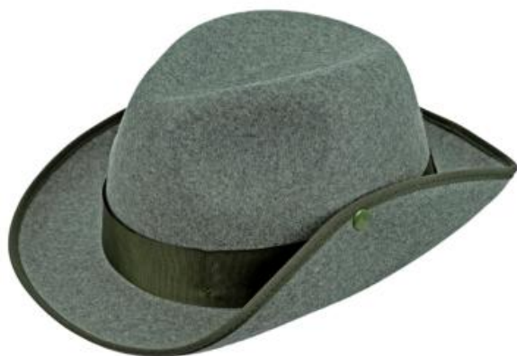
O272114 - hellgrün-meliert, mit Druckknopf Gr. 54 - 63 64,95 €

Schützenhut 100% Wolle, mit extrabreiter Krempe und Einfassband Seitlicher Druckknopf zum Hochklappen der Krempe, Ripsband