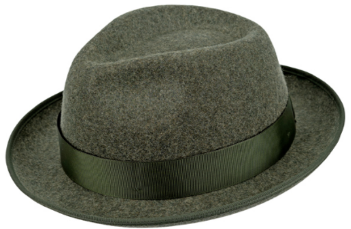
0272102 - dunkelgrün-meliert