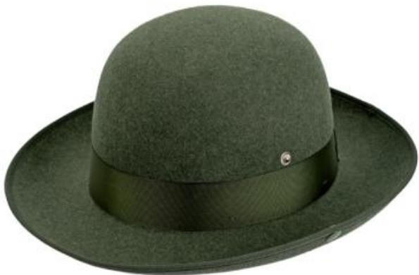
0272164 - dunkelgrün-meliert