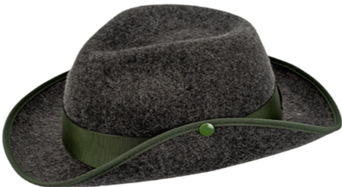
0272113 - grau-meliert, mit Druckknopf Gr. 54 - 63 59,95 €