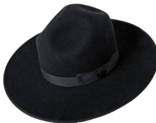
F158 Zimmermannshut, 100% Wolle Randbreite 12 cm Gr. 54 - 62 79,50 €