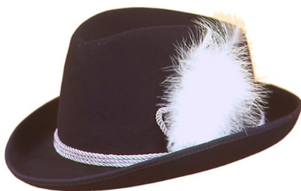
S16066 Trachtenhut auf Anfrage