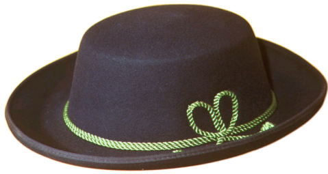
S16060 Musikerhut "Baden" auf Anfrage

Übergrößen-Zuschlag ab Kopfweite 62 - Preisänderungen vorbehalten.