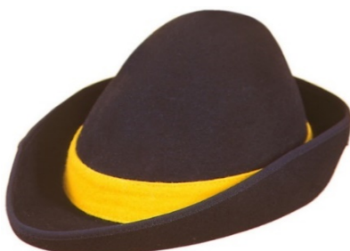
S16075 Robin Hood auf Anfrage