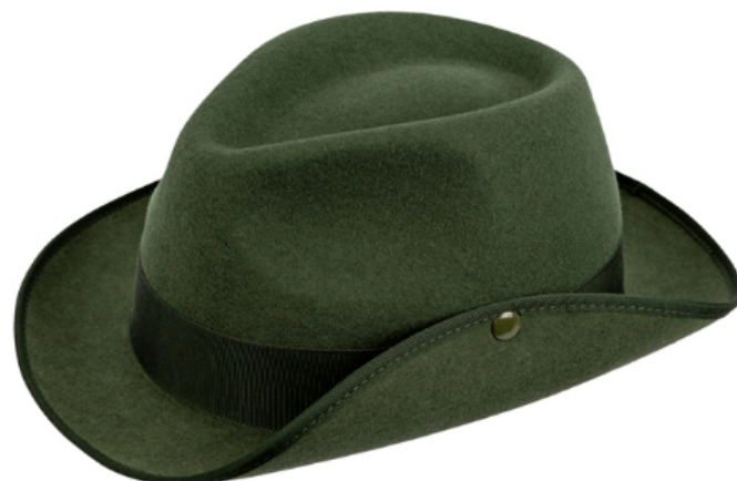
O272115 - olivgrün, mit Druckknopf Gr. 54 - 63 64,95 €