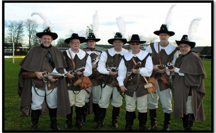
Hunteburger Karbid Böller Verein

Sonderanfertigungen Modell und Farbe nach Wunsch