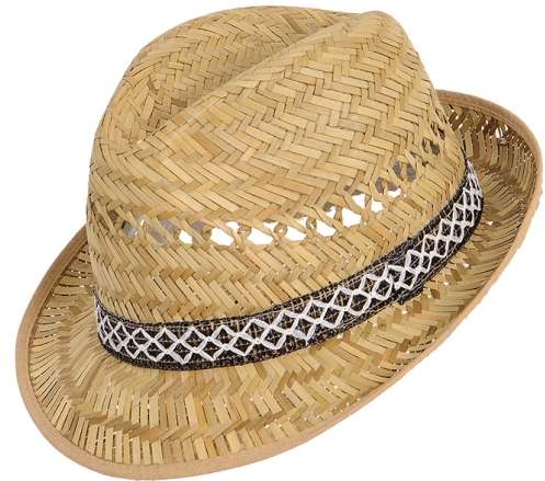
F2004 Trilby, 100% Stroh, Fb. natur Gr. 53 - 63 14,50 €