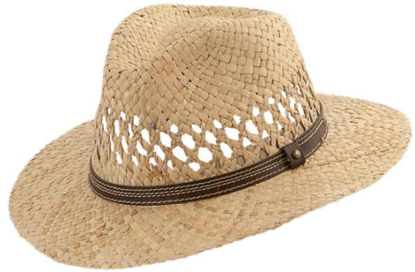
F44637 Hut, 100% Stroh, Fb. natur Gr. 55, 57, 59, 61, 63 16,95 €