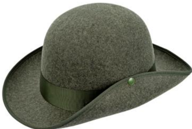
0272162 - oliv-meliert