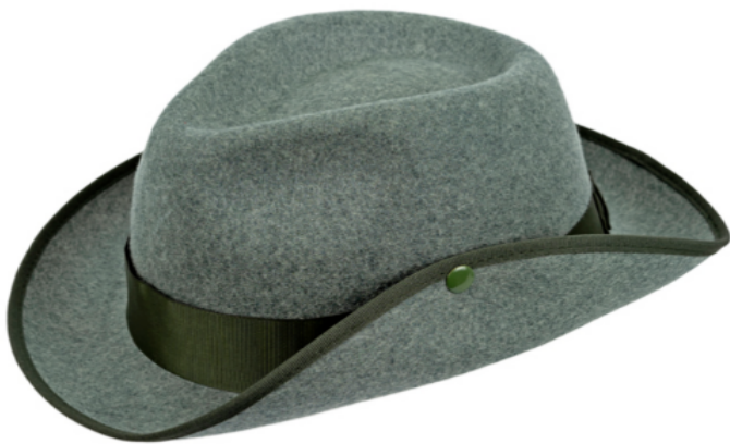
0272111 - grün-meliert, mit Druckknopf Gr. 54 - 63 59,95 €

Klassischer Schützenhut 100% Wolle, mit Krempe und Einfassband Seitlicher Druckknopf zum Hochklappen der Krempe, Ripsband