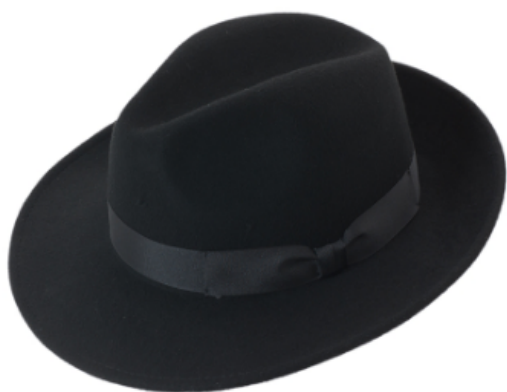
F36501 Bogart-Hut, 100% Wolle, schwarz Hut- und Einfassband schwarz Gr. 54 - 61 42,50 €