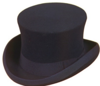
S23020 Biedermeier-Zylinder, 100% Wollfilz Band und Einfass schwarz Höhe 14 - 16 cm 159,00 € Höhe > 16 cm 199,00 €