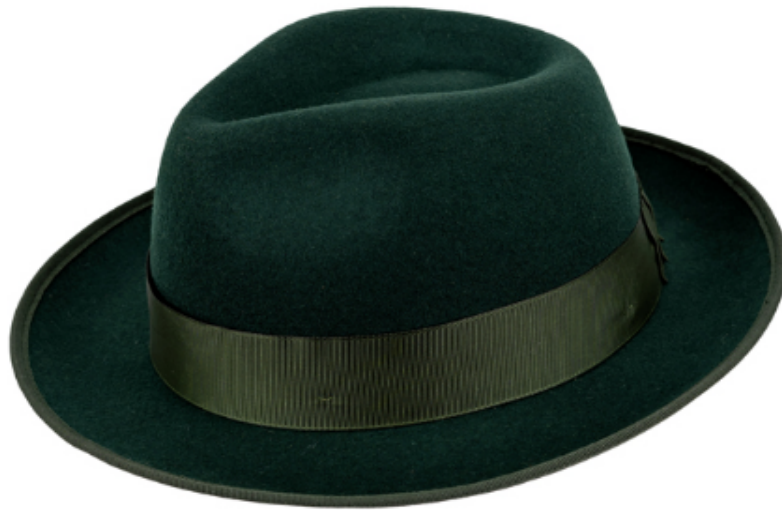
0272100 - Fb. 315 olivgrün 54,95 €

Klassischer Schützenhut, 100% Wolle, mit Hutband und Einfassband grün in Ripsoptik. Innen mit Hutband aus Leder-Imitat für optimalen Tragekomfort