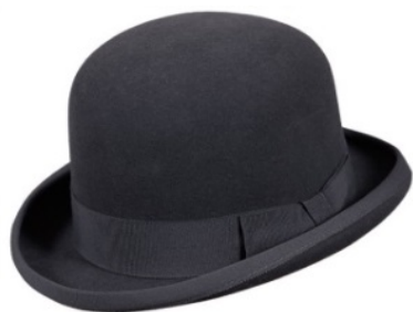
S16020 Melone, 1 A 100% Wollfilz schwarz, rot, blau, grün 139,00 €