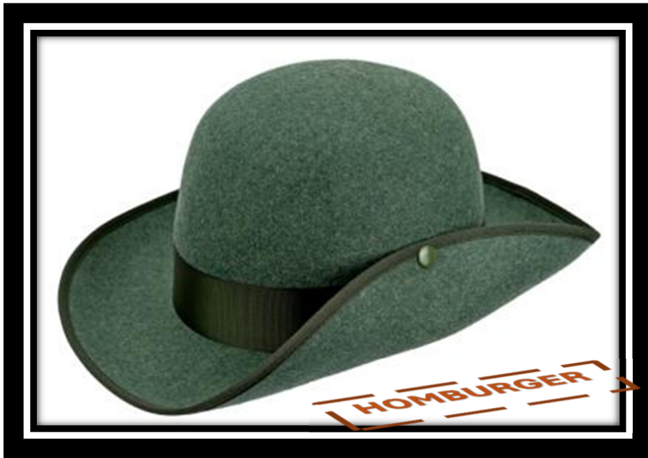
0272163 - hellgrün-meliert 64,95 €

Schützenhut "HOMBURG", 100% Wolle, mit Hutband und Einfassband grün in Ripsoptik. Innen mit Hutband aus Leder-Imitat für optimalen Tragekomfort