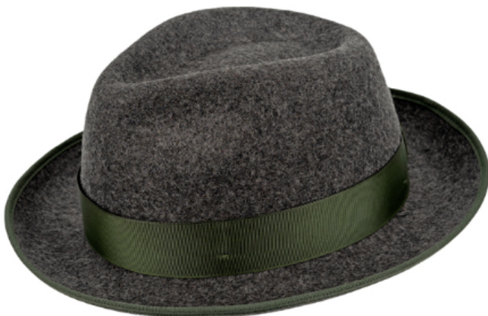
0272103 - mittelgrau-meliert