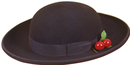
S16051 Renchtaler Trachtenhut auf Anfrage