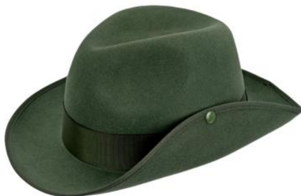
O272134 - schützengrün, mit Druckknopf Gr. 54 - 63 64,95 €