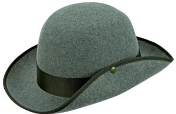
0272161 - hellgrün-meliert