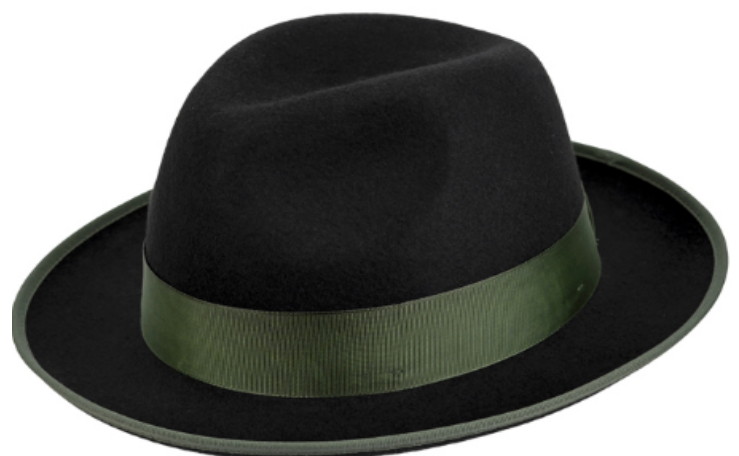
0272106 - schwarz