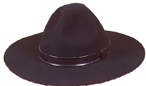
S23065 Pfadfinder auf Anfrage