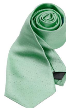
Trachtenkrawatte, REINE SEIDE - K 364