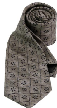
Trachtenkrawatte, REINE SEIDE - K 958