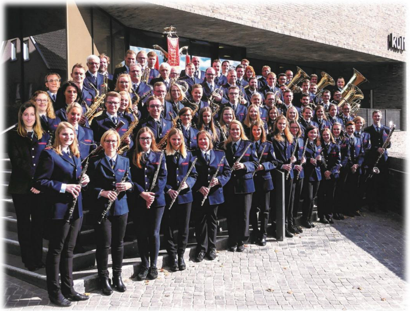
Musikzug der Freiwilligen Feuerwehr Vreden e.V. @MusikzugVreden · Orchester