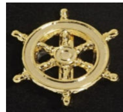
A 1089 Anstecknadel, Metall gold, Motiv Anker, Schraube oder Steuerrad