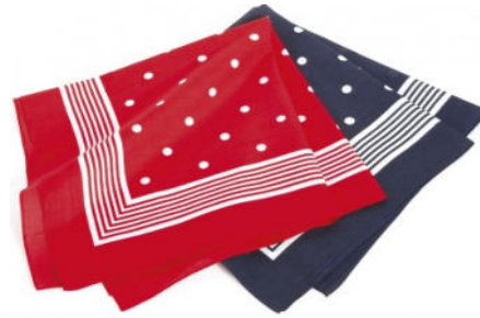
A 1096 Halstuch, ca. 70 x 70 cm, 100% Baumwolle, bedruckt Paisleymuster, Tupfen, oder einfarbig, jeweils blau oder rot