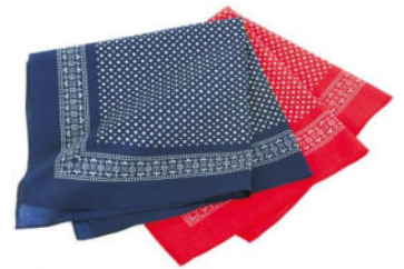
A 1090 Halstuch, ca. 54 x 54 cm, 100% Baumwolle, bedruckt