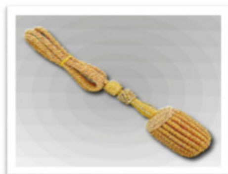
67040 - Portepee mit Bouillonraupen 20 Bouillonraupen 50 mm, handüberkettelte Eichel 1 überklöppelter Schieber