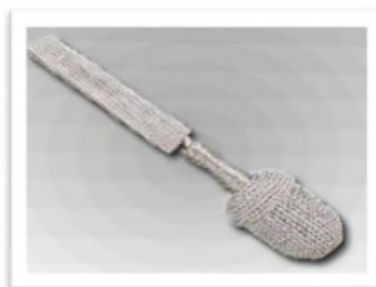
67010 Portepee mit überklöppelter Eichel Große, runde Quaste mit 1 handgestochenen Schieber 40 cm lange 16 mm breite Tresse