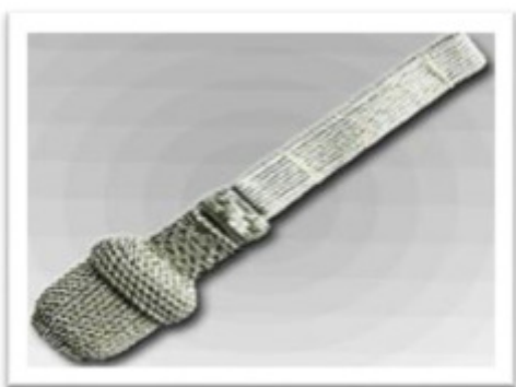
67020 - Portepee mit kleiner ovaler Quaste handgestochene Eichel, 1 handgestochener Schieber 40 cm lange 16 mm breite Tresse