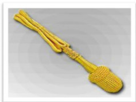
67000 -Portepee mit überklöppelter Eichel, Kleine, runde Quaste, 2 handgestochene Schieber 40 cm lange 4 mm starke Rundschnur