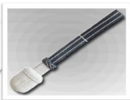
67031 - Portepee mit großer ovaler Quaste handgestochene Eichel, 1 handgestochener Schieber 40 cm langer Lederriemen bestickt, 20 mm breit