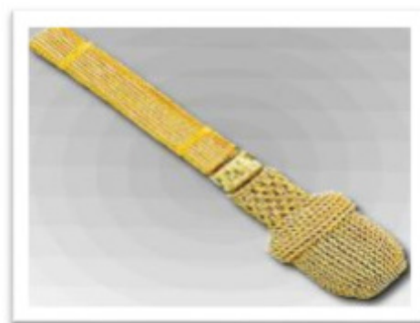
67030 - Portepee mit großer ovaler Quaste handgestochene Eichel, 1 handgestochener Schieber 40 cm lange 16 mm breite Tresse